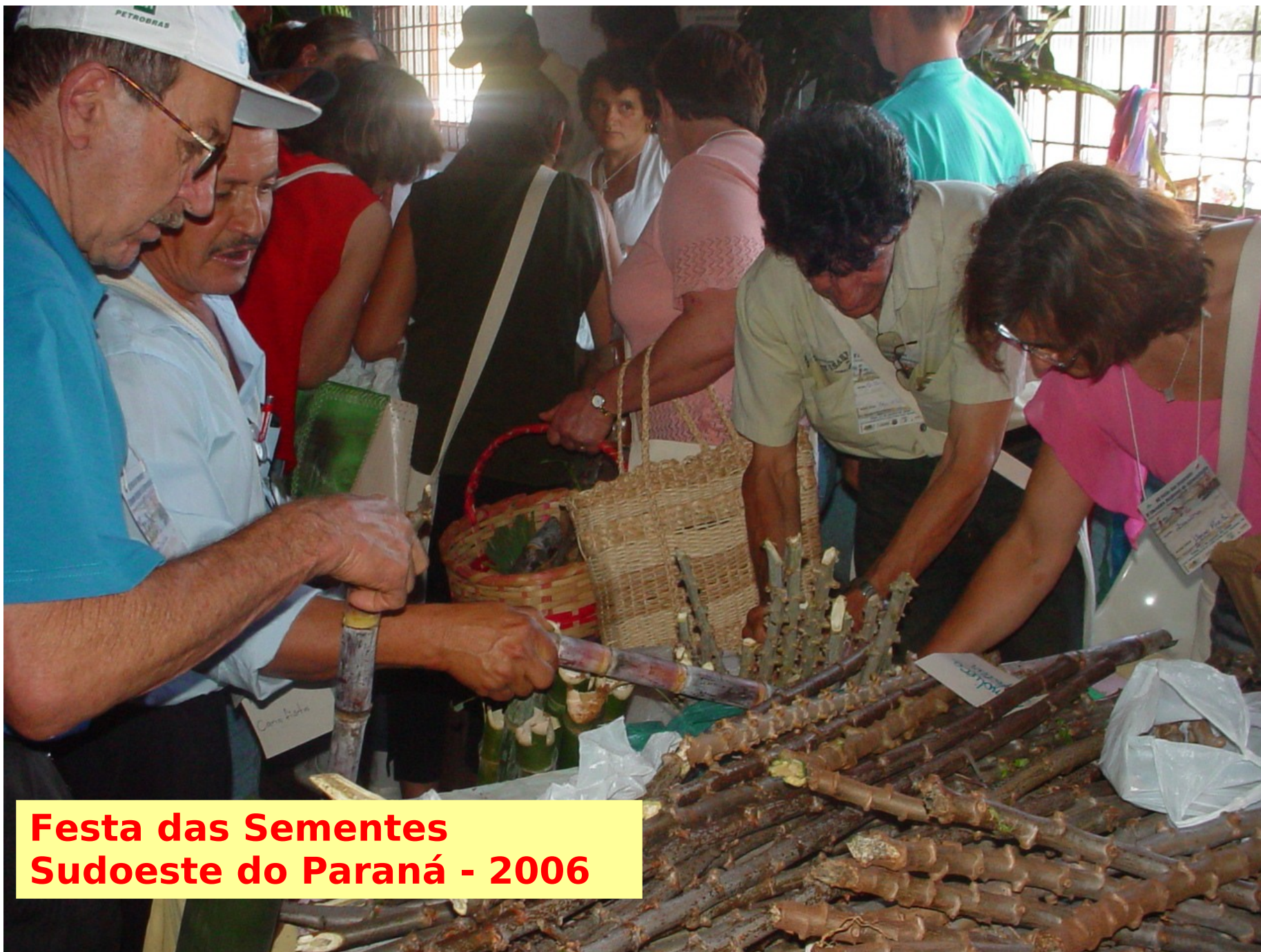
Festa das Sementes Sudoeste do Paraná - 2006