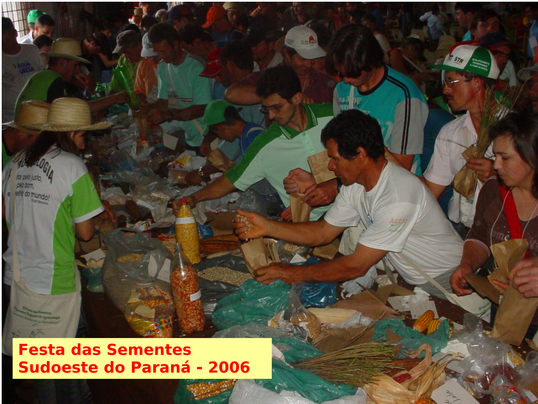
Festa das Sementes Sudoeste do Paraná - 2006