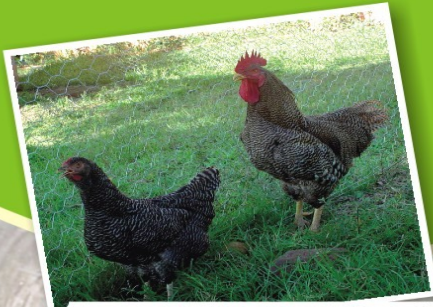
Plymouth Rock Barrado (Carijó)