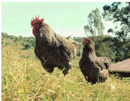
Plymouth Rock Barrado – Carijó